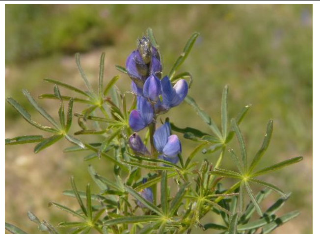
Lupinus angustifolius subsp. reticulatus