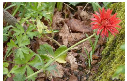
Anemone hortensis subsp. Pavonina vers Chastanet à Brive.